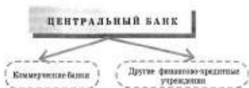
Схема банковской системы:

Банковская система — совокупность действующих в стране банков и других кредитных учреждений и организаций.